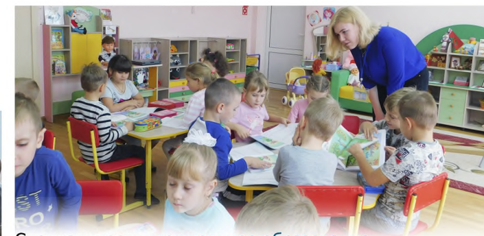
Специальность: дошкольное образование Квалификации: воспитатель дошкольного образования Срок обучения: 2 года 10 месяцев