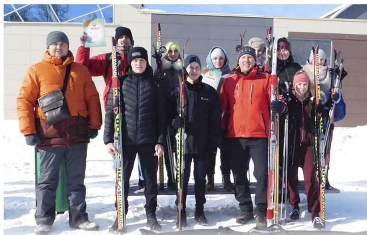
Специальность: обучение физической культуре Квалификации: учитель Срок обучения: 2 года 10 месяцев

Дни открытых дверей в 2025/2026 учебному году: 29 ноября, 28 февраля и 25 апреля.