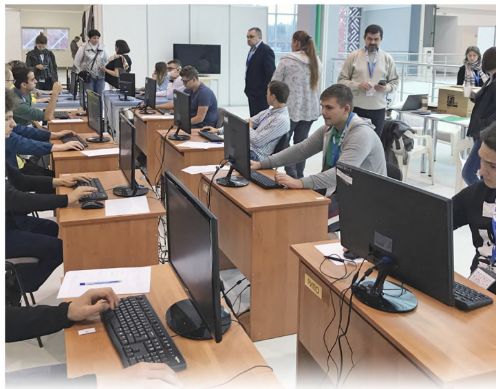
Специальность: разработка и сопровождение программного обеспечения информационных систем Квалификации: оператор ЭВМ, техник-программист Срок обучения: 3 года 10 месяцев