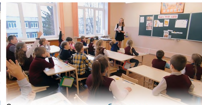
Специальность: начальное образование Квалификации: учитель Срок обучения: 2 года 10 месяцев